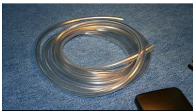
Durchsichtiger Plastikschlauch: Innendurchmesser ca. 12 mm.