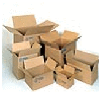
als Hindernisse z.B. Kartonschachteln