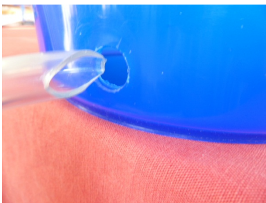
Die Gefäße V und W haben unten je ein Loch und das Gefäß Z zwei Löcher. Die Durchmesser der Löcher müssen ca. 1 mm kleiner als der Aussendurchmesser des Schlauches sein.